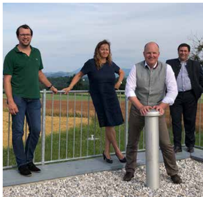
Unser Team steht bereit für die nächsten Aufgaben.